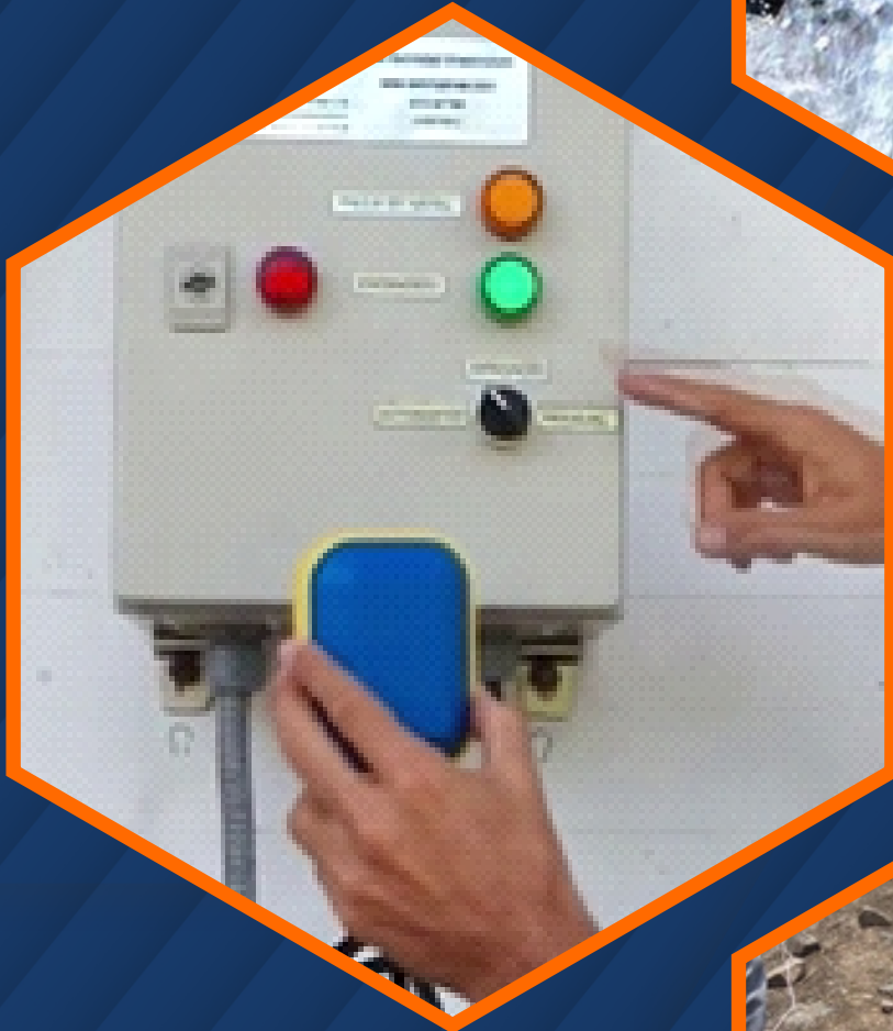
Instalaciones de tableros de arranque eléctrico